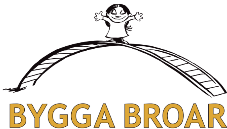
Bild: omslaget på stödmaterialiet för integrering av Bygga Broar

- Ett stödmaterial i en integrering av utvecklingsarbetet Bygga Broar