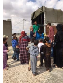
Skolpaket till barnen på skolan i Zataari, Mat- och hygienpaket delas ut i Zataari Village