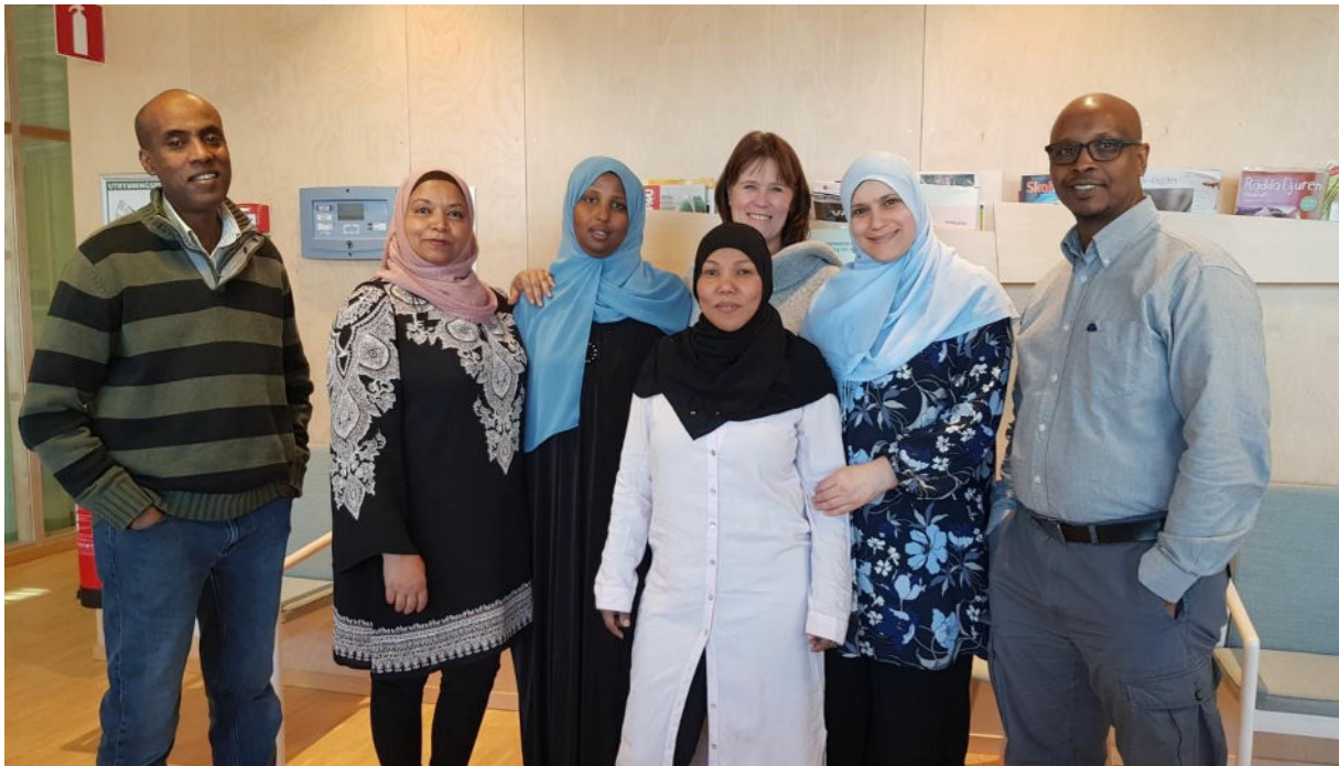
Bild på Bygga Broarteamet i Västra Hisingen