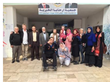
Skolan i Rahaba, Kläddutdelning i Rahaba, Erfarenhetsutbyte i Rahaba

Förutom besök på skolor så har vi också kunnat dela ut 150 matpaket och 100 hygienpaket och kläder både i Zataari och Rahaba dessa gåvor var alla skänkta av privatpersoner genom insamling i Sverige. Tack vare en donation från Nord-Lock AB har vi kunna lägga ett betonggolv på skolgården